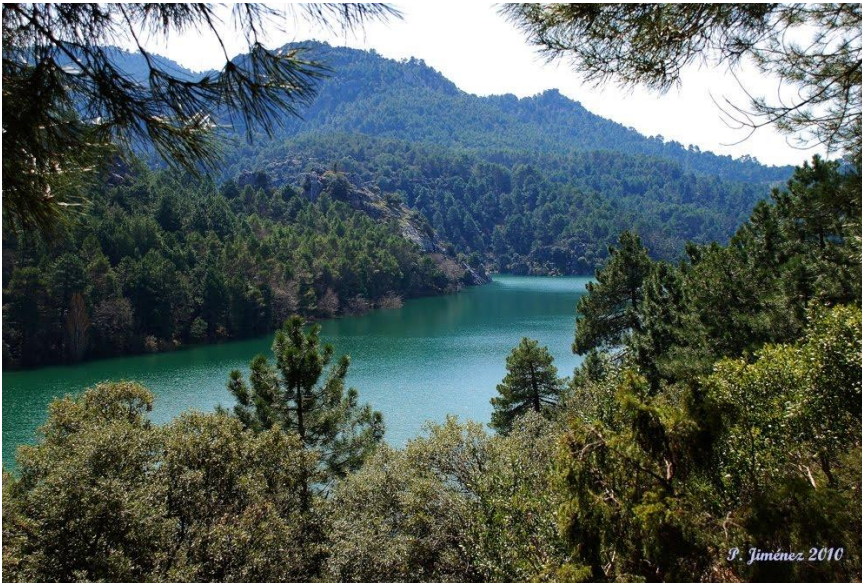
Embalse del Aguascebas.