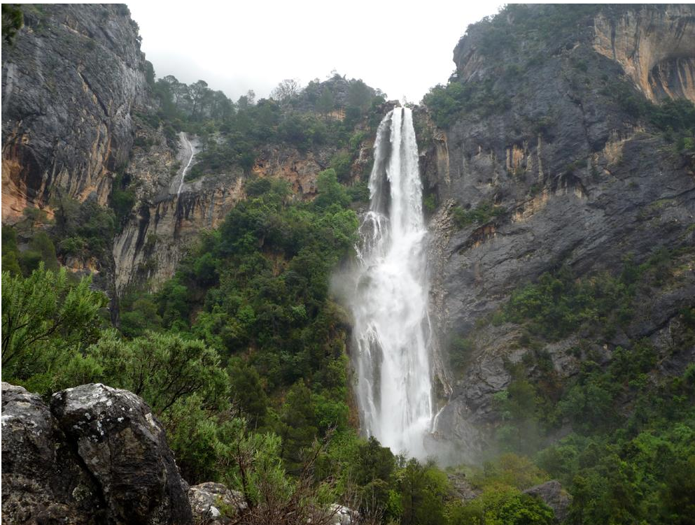
Cascada de la Osera (la cascada más alta de Andalucía)