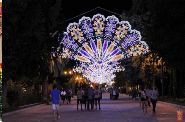
Feria (septiembre.)