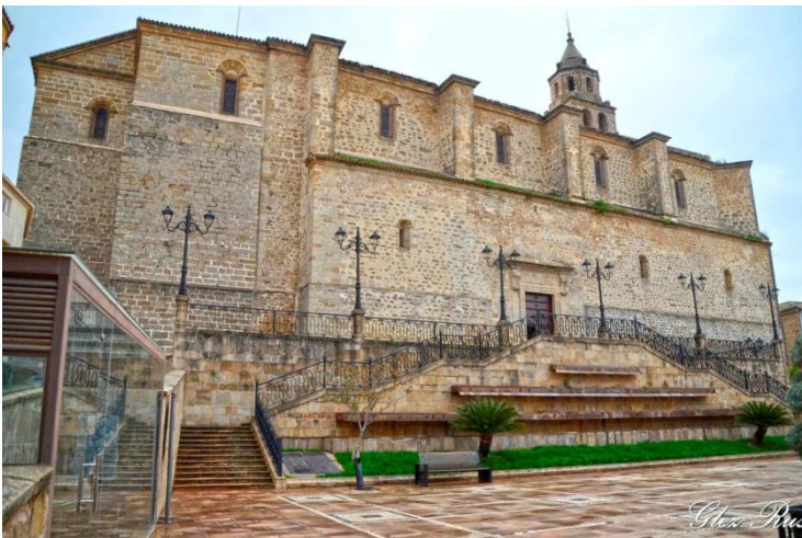
Iglesia principal.