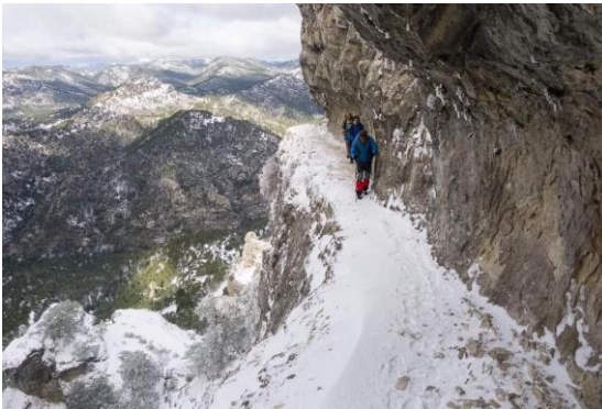
Invierno en Sierra de Cazorla