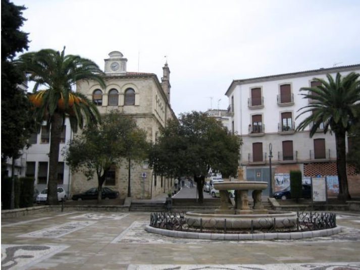
Plaza del Ayuntamiento